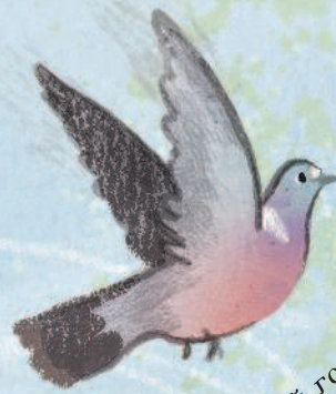
Лесной голубь вихирь

Добро пожаловать в густой лес. Кругом высокие стволы, всё погружено в полумрак. Мы в гостях у огромного множества растений, животных, грибов и микроорганизмов. Каждое дерево — это целый мир с тысячами жителей. Все они взаимодействуют друг с другом и с окружающей средой, постоянно «изобретая» удивительные способы, как выжить и сделать свою жизнь лучше.