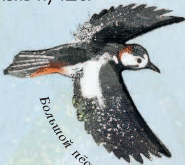
Большой пестрый дятел