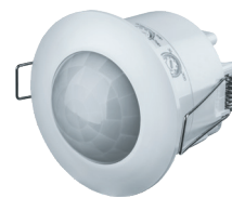
NS-IRM07-WH 1200 Вт, IP33, 360°, 6 м