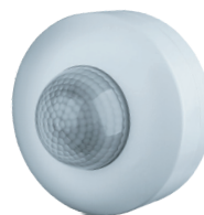
NS-IRM08-WH 1200 Вт, IP33, 360°, 12 м