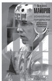
БОРИС МАЙОРОВ ХОККЕЙНЫЕ ПЕРЕКРЁСТКИ