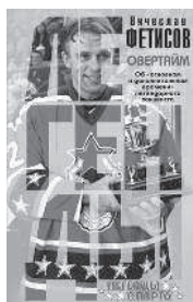
ВЯЧЕСЛАВ ФЕТИСОВ ОВЕРТАЙМ