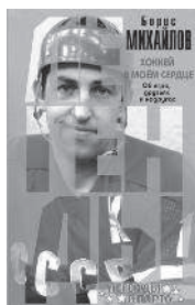
БОРИС МИХАЙЛОВ ХОККЕЙ В МОЁМ СЕРДЦЕ