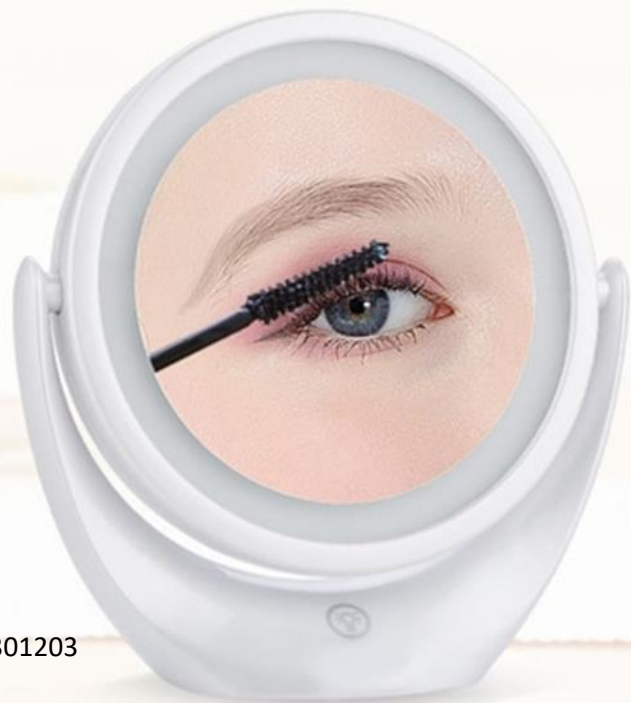
ЗЕРКАЛО С 5 КРАТНЫМ УВЕЛИЧЕНИЕМ