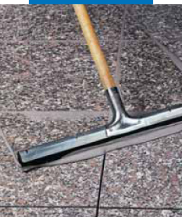
Заполнение швов в гранитных полах резиновой раклей