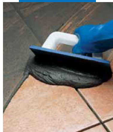
Заполнение швов в плитке на полу резиновым шпателем