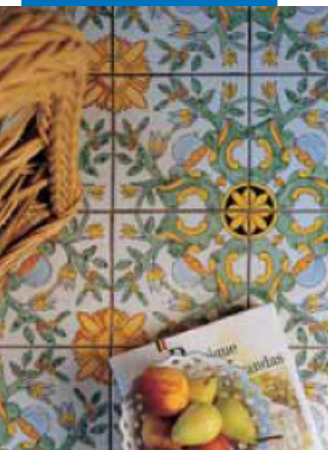
Пример шпаклевки половое покрытие из плитки двойного обжига

Вся необходимая справочная информация по материалу доступна по запросу, а также на сайте www.mapei.com