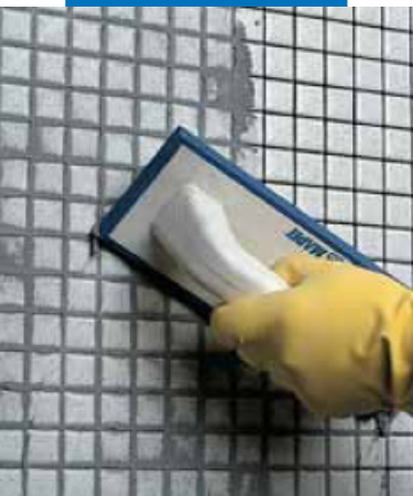
Заполнение швов в стеклянной мозаике (ванная комната) шпателем