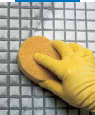
Очистка стеклянной мозаики губкой