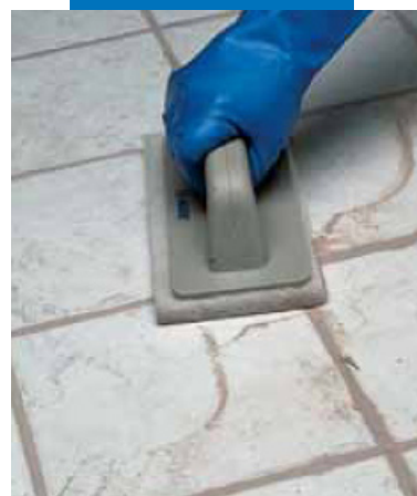
Очистка с помощью панели Scotch-Brite®