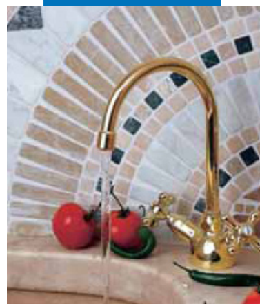
Пример заполнения швов в мозаике на кухне