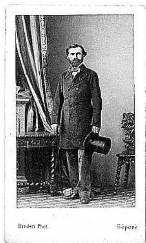
Фотопортрет Джузеппе Верди в формате «визитной карточки», 1850-е