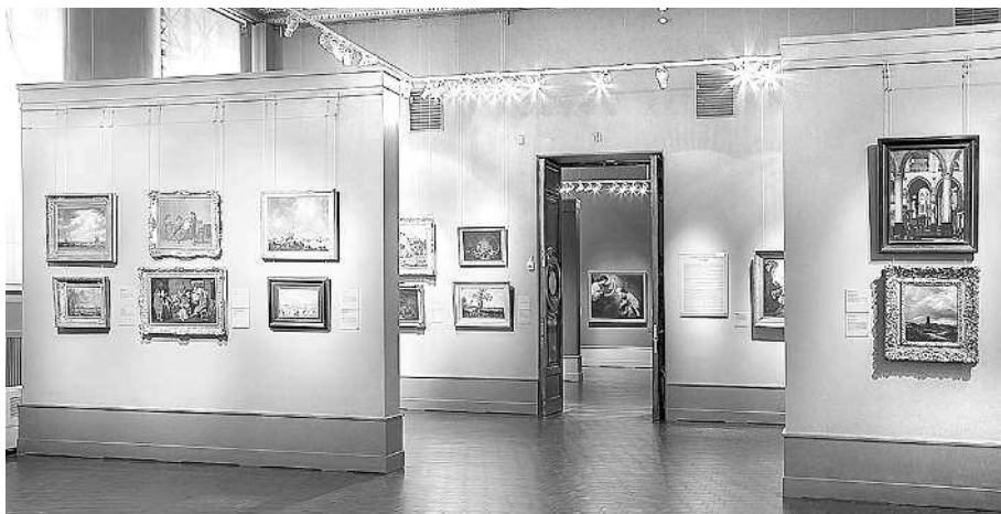
Вид голландского зала в ГМИИ им. А.С. Пушкина.

Несходство вкусов особенно заметно на примере натюрмортов: роскошный фламандский стол, изображенный Снайдерсом, как будто прогибается под тяжестью разнообразной дичи, фруктов и овощей, которые разложены перед нами как королевские дары, и лебедь взмахивает крыльями, придавая энергии движению нашего взгляда от одного угощения к другому, как на карусели... а в соседнем зале нас ждет скромный «Завтрак» Питера Класа, где лишь несколько вполне обычных предметов (бокал вина, рыбина и булочка), написанных в холодной гамме, эта картина не кажется праздничной и не стремится увлечь зрителя, ее обаяние в мелочах, раскрывающихся опытному взгляду.