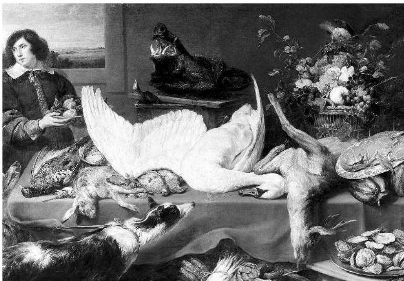
Франс Снайдерс. Натюрморт с лебедем. 1640-е. ГМИИ им. А.С. Пушкина