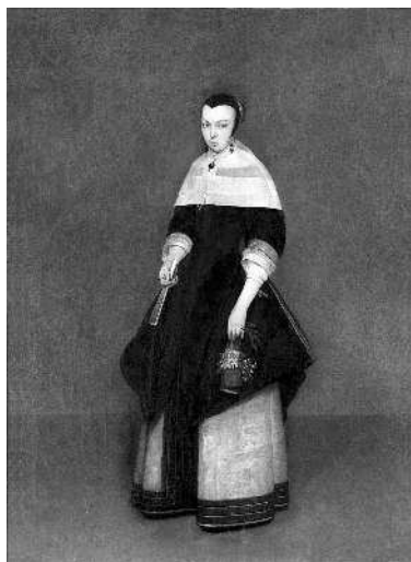
Герард Терборх. Портрет дамы. 1661. ГМИИ им. А.С. Пушкина

головным убором, немного кружева, несколько украшений, лаконичный силуэт — с первого взгляда можно и не догадаться, что это дорогой, парадный наряд. У себя дома голландки могли носить желтые и красные одежды, отороченные мехом, или нежно-голубые платья с глубоким декольте (которые особенно любил Терборх) — и это считалось deshabillé , неофициальным костюмом, а для выхода предпочитали черный цвет, который, с одной стороны, ассоциировался с аристократическим вкусом, а с другой стороны, отвечал кальвинистским требованиям умеренности. Однако мы должны понимать, что и «маленькое черное платье» будет отличаться у представительниц разных социальных страт: отличаются и ткани, и кружева, и аксессуары, и художник, прекрасно понимая это, показывает нам качество наряда своей героини, например, гладкость жемчужно-серого шелка на юбке. Терборх мастерски изображал фактуру предметов, это было одним из качеств, за которые его высоко ценили заказчики.