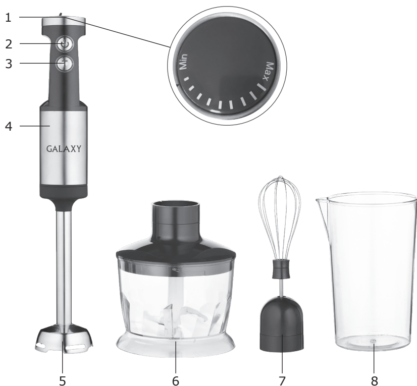
Элементы электроприбора (рис. 1):