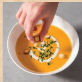
Со вкусом заверши декорирование крупными деталями.