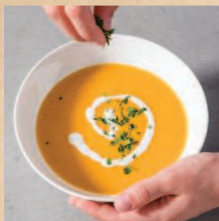
Держи руку выше для равномерного распределения.