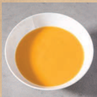
Обычный суп – скука!

Морковно-имбирный суп (с. 96) служит идеальным холстом, на котором можно отработать навыки декорирования. Смешай три части обычного йогурта с одной частью молока, чтобы получить сливочный соус правильной консистенции, которым можно будет украсить суп. Используй специальную бутылку-распылитель (мегаизысканный вариант) или маленькую ложку (как показано на фото). Посыпь рубленой кинзой, а напоследок добавь несколько гренок.