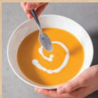
Нарисуй сливочный узор.