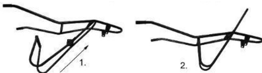
СХЕМА СБОРКИ И КОМПЛЕКТАЦИЯ ТАЧКИ СТРОИТЕЛЬНОЙ ELAND GIGANT 350-2 PROFİ