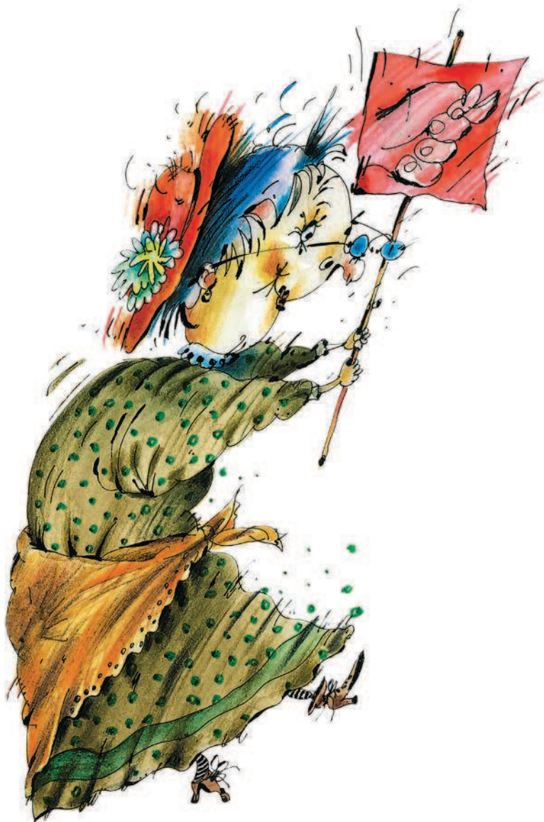
Рисунки А. Мартынова