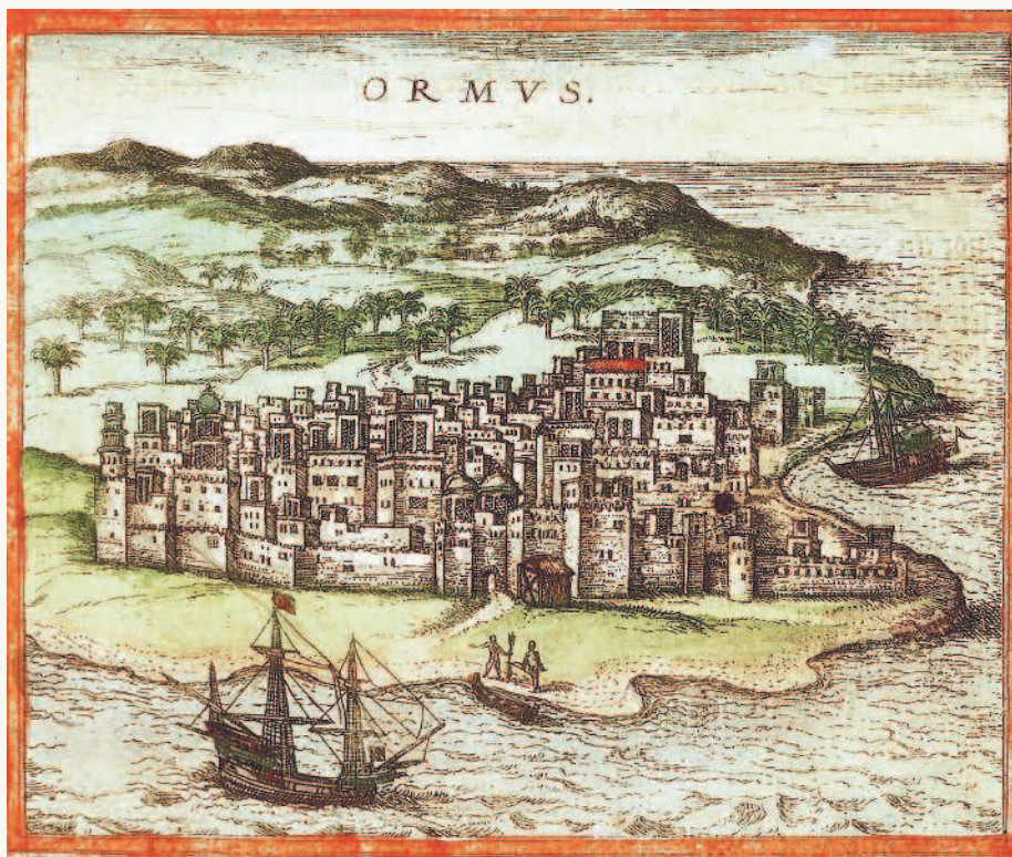
Изображение Ормуза, в котором Никитин побывал дважды. ▲ Рисунок из атласа XVI века

О своем более чем двухлетнем пребывании в иранских землях Никитин пишет крайне скупое, просто перечисляя города, в которых он побывал. Добравшись до Чапакура, тверской купец провел в этом прикаспийском городе полгода, посетил славившиеся шелком и коврами Сари и Амоль, перевалив через горный хребет Эльбрус, добрался до селения Демавенд,