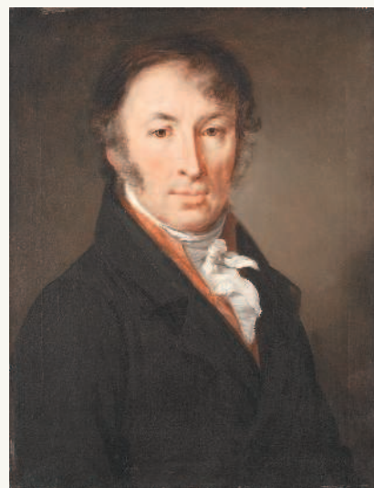
Тропинин В.А. ▲ Портрет Н.М. Карамзина. 1818 г.

Несомненно, Никитин был опытным путешественником, которому неоднократно доводилось покидать пределы русских земель, — в его записках не раз упоминаются различные торговые пути, и многие страницы дневника написаны на смеси тюркского и фарси, своеобразном купеческом жаргоне,