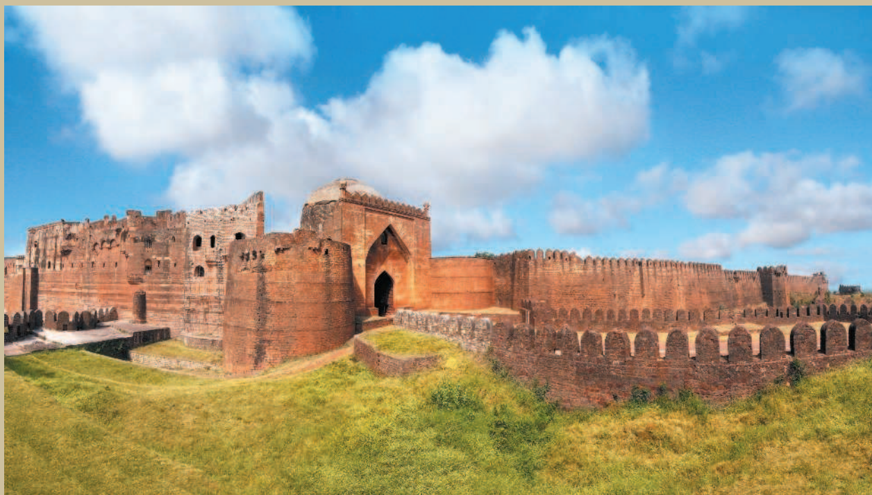
Крепость в городе Бидар, которую посетил Афанасий Никитин