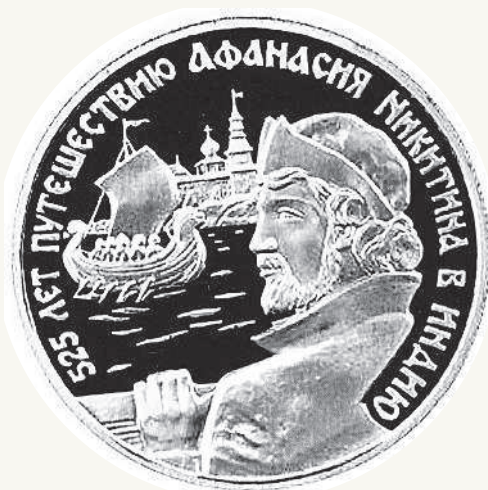
Серебряная монета Банка России, ▲ отчеканенная в честь путешествия Никитина