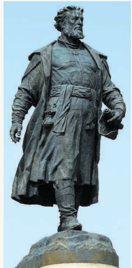
Памятник Афанасию Никитину в Твери. Установлен в 1955 году на левом берегу Волги ▼

С тех пор «Хождение за три моря» издавалось не раз, в том числе и в переводах на другие языки. В 1955 году в Твери был установлен памятник Афанасию Никитину, а в 1957 году имя тверского купца получила вершина крупного подводного горного массива в Индийском океане.