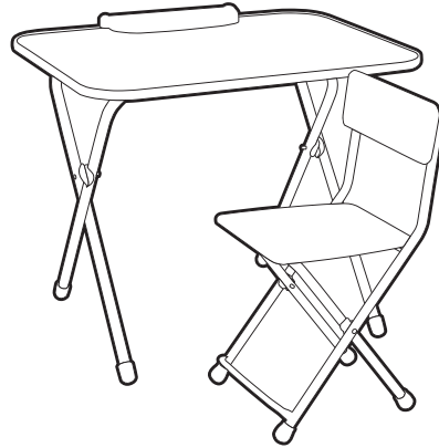
(рис. 1) Комплект мебели, арт. NK-75/1, NK-75/2, NK-75/3

Перед эксплуатацией следует ознакомиться с паспортом и руководством по эксплуатации. Следуя инструкции, выполните установку стола и стула.