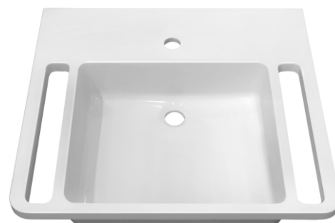
УМЫВАЛЬНИК CARE 600

Рекомендованная высота верхнего края раковины - 850 мм от уровня пола с минимальным свободным пространством 300 мм на высоте 700 мм под раковиной для обеспечения лёгкого доступа лицам передвигающимся на инвалидном кресле.