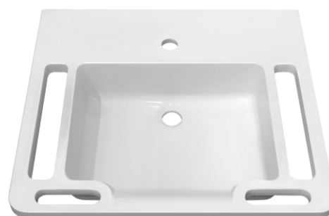
УМЫВАЛЬНИК CARE G 600

Рекомендованная высота верхнего края раковины - 850 мм от уровня пола с минимальным свободным пространством 300 мм на высоте 700 мм под раковиной для обеспечения лёгкого доступа лицам передвигающимся на инвалидном кресле.