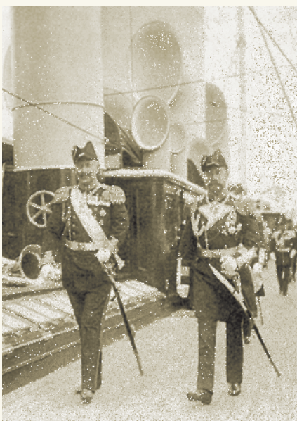
Вильгельм II и Николай II ▲ на борту корабля.

через Багдад до Кувейта. В 1903 г. проект был принят Турцией, и началось строительство. Англия в качестве ответного действия захватила Кувейт. Силовая политика совмещалась с тайной дипломатией, договорами, скрытыми и явными компромиссами, мнимыми и реальными угрозами, маневрами и т.д. Мировой войне предшествовал ряд локальных войн, который стал предвестником последующих трагических событий.