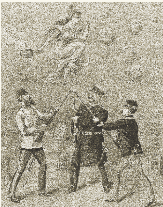
Воображаемый образ Тройственного союза против Франции. В действительности три державы были расколоты глубокими взаимными подозрениями. Ни немцы, ни австрийцы не были удивлены, когда в 1914 г. Италия вышла из альянса. На каждом из пузырей написано название французской колонии.