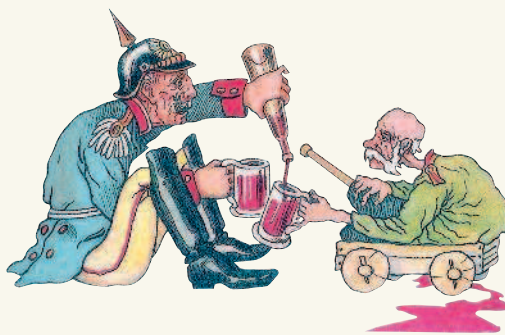
Русская карикатура на императоров Вильгельма II и Франца Иосифа I.

в 1908 г., когда английский король Эдуард VII и Николай II, встретившись в Ревеле, обменялись мнениями о предстоящей совместной войне с Германией.