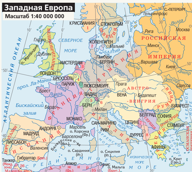
Западная Европа Масштаб 1:40 000 000