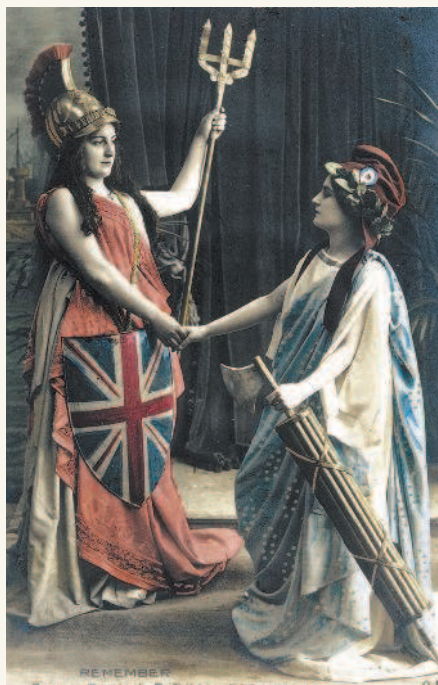
Британия и Марианна (символ Французской республики)жимают друг другу руки.

Англия, опасаясь усиления кайзеровской Германии и видя в ней главного своего противника, постепенно отошла от традиционной политики «блестящей изоляции» и стала искать пути сближения со своим старым колониальным соперником — Францией. Перед лицом германской опасности правительства двух государств пришли к выводу о необходимости договориться по основным колониальным и другим спорным вопросам, что создавало условия для дальнейших переговоров о совместных действиях против Германии. В апреле 1904 г. между Англией и Францией было заключено «сердечное согласие», или Антанта. Этим соглашением между ними были улажены колониальные распри в Египте,