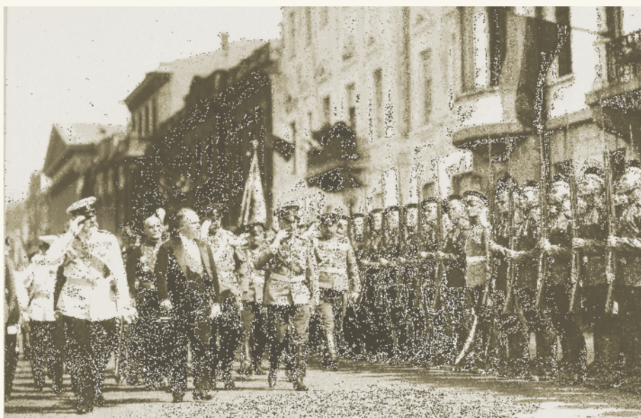
Визит президента Франции Пуанкаре в Россию накануне войны. ▲

Однако система международных отношений к этому времени стала взрывоопасной. В Европе в результате завершения процессов объединения на европейскую и мировую политическую сцену вышли Германия и Италия в качестве равноправных субъектов международных отношений. Их столкновение с Англией, Францией, Россией,