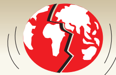
Карта мира накануне Первой мировой войны