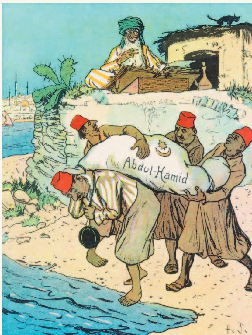
Карикатура, изображающая свержение Абдул-Хамида II ▲ 27 апреля 1909 г.

через Багдад до Кувейта. В 1903 г. проект был принят Турцией, и началось строительство. Англия в качестве ответного действия захватила Кувейт. Силовая политика совмещалась с тайной дипломатией, договорами, скрытыми и явными компромиссами, мнимыми и реальными угрозами, маневрами и т.д. Мировой войне предшествовал ряд локальных войн, который стал предвестником последующих трагических событий.