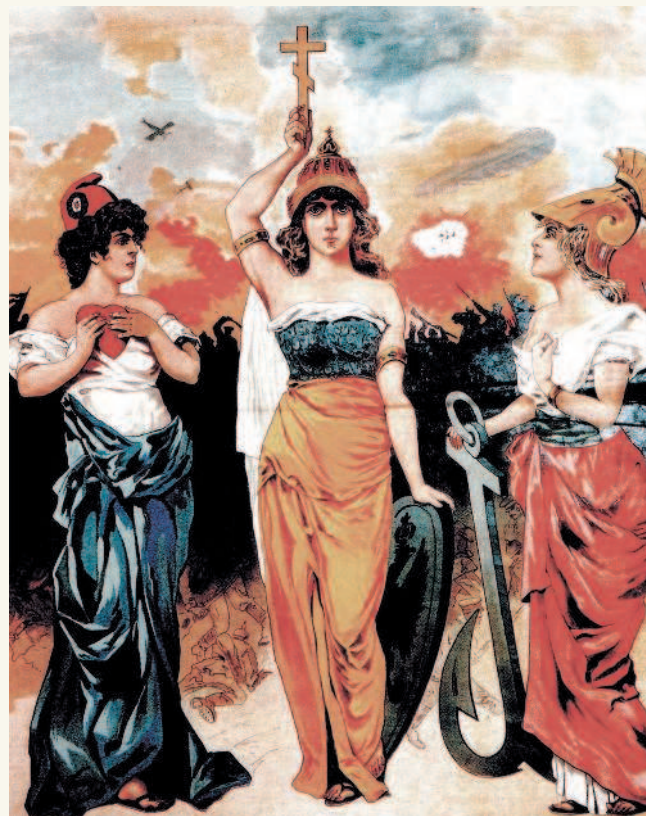
«Три правительства соглашаются в том, что, когда настанет время для обсуждения условий мира, ни один из союзников не будет ставить мирных условий без предварительного соглашения с каждым из других союзников». Тройственное соглашение стран Антанты, 5 сентября 1914 г.

о совместной борьбе против усилившегося в странах Азии революционного и национально-освободительного движения. Англо-русское соглашение определило зоны, в которых партнеры обладали свободой действий по «поддержанию порядка». Образование военно-политического блока России и Англии было завершено