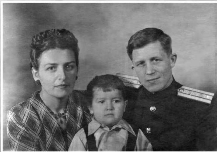
С родителями, 1947 г.

Когда мне было лет десять, мама купила мне «бобриковое» пальто. В те времена народ в нашем доме жил весьма скудно, все стеснялись ходить в хорошей одежде, чтобы не выделяться на общем фоне. Я специально упал с карусели в лужу, будто бы сорвался — пальто сразу стало не новым. Даже в институт я поступал в отцовс-