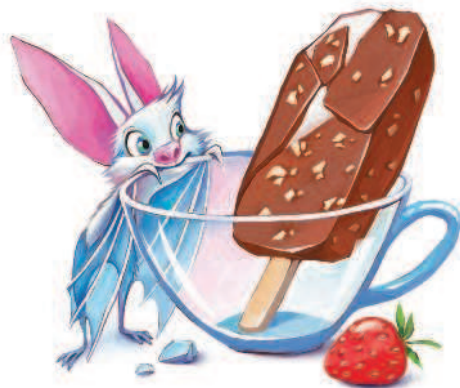
Иллюстрации Екатерины Петрушиной