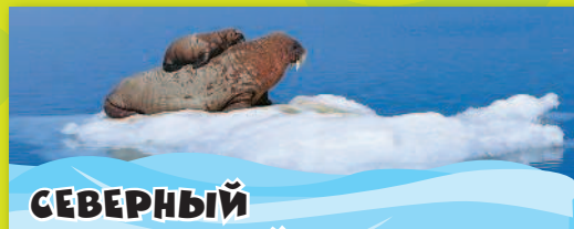
СЕВЕРНЫЙ ЛЕДОВИТЫЙ ОКЕАН

Здесь ты прочитаешь о секретах обитателей вод, расположенных между Гренландией и Исландией на севере, Европой и Африкой на востоке, обеими Америками на западе и Антарктидой на юге.