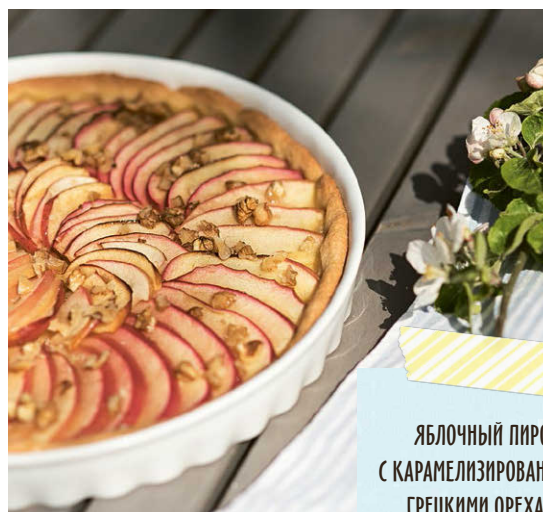
ЯБЛОЧНЫЙ ПИРОГ С КАРАМЕЛИЗОВАННЫМИ ГРЕЦКИМИ ОРЕХАМИ Рецепт на с. 193