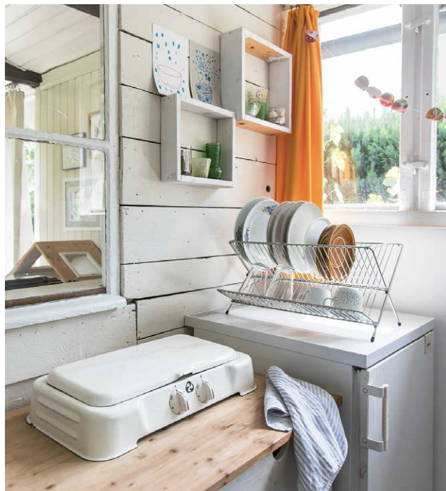
КОМНАТА С ОКНОМ. РАНЬШЕ ПРОСТРАНСТВО ОГРАНИЧИВАЛОСЬ ЕЮ, НО БЛАГОДАРЯ ПРИСТРОЙКЕ В ДОМЕ НАШЛОСЬ МЕСТО И ДЛЯ МИНИ-КУХНИ. ОКНО СОЗДАЕТ ЗДЕСЬ НЕВЕРОЯТНО РОМАНТИЧЕСКУЮ АТМОСФЕРУ.