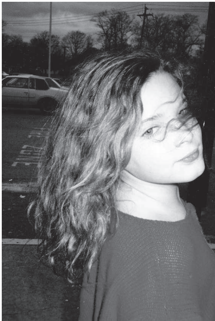
Ким в девять лет.