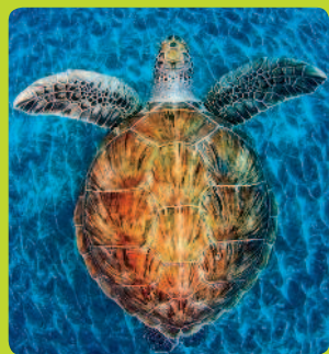
ЧЕРЕПАХИ 3,4 %