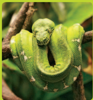
ЧЕШУЙЧАТЫЕ 96,3 %

Специалисты делят современных рептилий на 4 отряда.