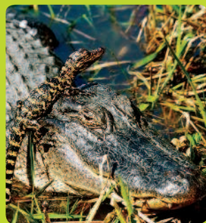
КРОКОДИЛЫ 0,3 %