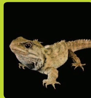
КЛЮВОГОЛОВЫЕ 0,01 %