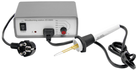
Выжигательная станция с температурным контролем ZD-8905