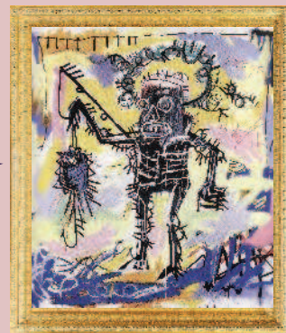
Жан-Мишель Баския, «Без названия», 1981