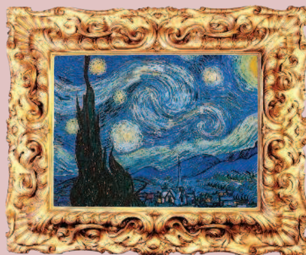
Винсент ван Гог, «Звёздная ночь», 1889