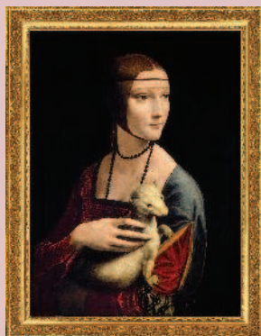
Леонардо да Винчи, «Дама с горностаем», 1490

После появления цифровой фотографии точная передача окружающего мира стала не так актуальна, гораздо важнее стало личное отношение художника к окружающей действительности, его мысли, эмоции, внутренний мир. Со времен импрессионистов искусство стало все больше выражать личность человека и его индивидуальное восприятие реальности. Людям важно, что думаете именно вы. Ваши впечатления и эмоции.