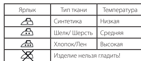
ТАБЛИЦА ТЕМПЕРАТУРНЫХ РЕЖИМОВ ДЛЯ ГЛАЖЕНИЯ РАЗЛИЧНЫХ ВИДОВ ТКАНИ

Первый нагрев: примерно 2-3 минуты, непрерывная работа — около минуты.