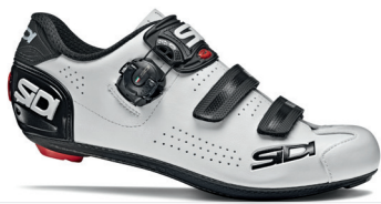
WHITE | BLACK BIANCO | NERO