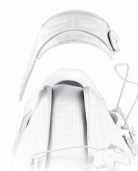
SOFT INSTEP 3

.. E' un cinturino posizionato sul collo del piede, sagomato, morbido e anatomico accoppiato con un materiale soffice per maggior comfort. Distribuisce la pressione in modo omogeneo sul collo del piede e si regola su entrambi i lati per avere una posizione perfettamente centrata del cinturino a seconda che il collo del piede sia basso o alto. Il sistema elimina la necessità di usare un distanziale. SOFT INSTEP è sostituibile.