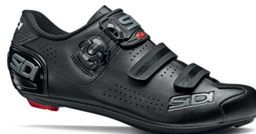
BLACK | BLACK NERO | NERO