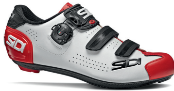
WHITE | BLACK | RED BIANCO / NERO / ROSSO