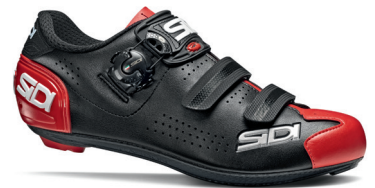
BLACK | RED NERO | ROSSO