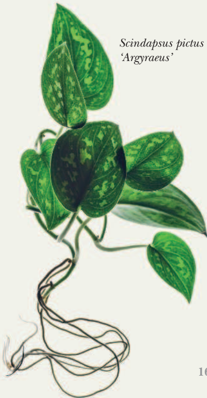
Scindapsus pictus 'Argyraeus'

Вам приходилось когда-нибудь заходить в питомник или оранжерею и моментально чувствовать перемену в воздухе? Вы откидываете голову назад, закрываете глаза, делаете глубокий вдох — и вас сразу охватывает