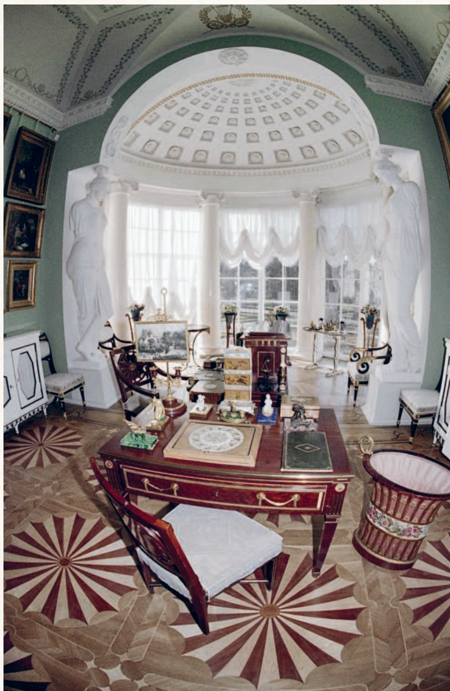
Кабинет «Фонарик» в Павловском дворце