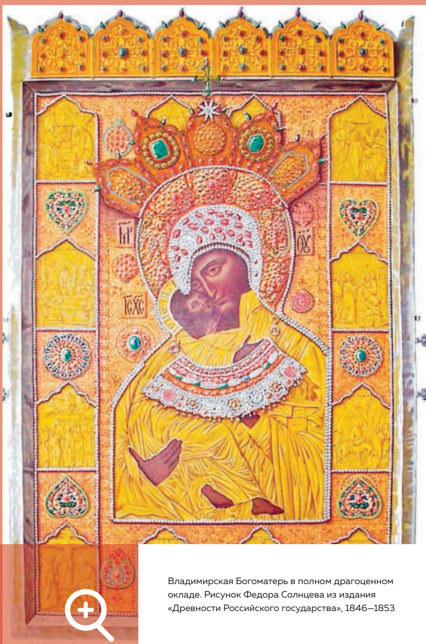
Владимирская Богоматерь в полном драгоценном окладе. Рисунок Федора Солнцева из издания «Древности Российского государства», 1846–1853