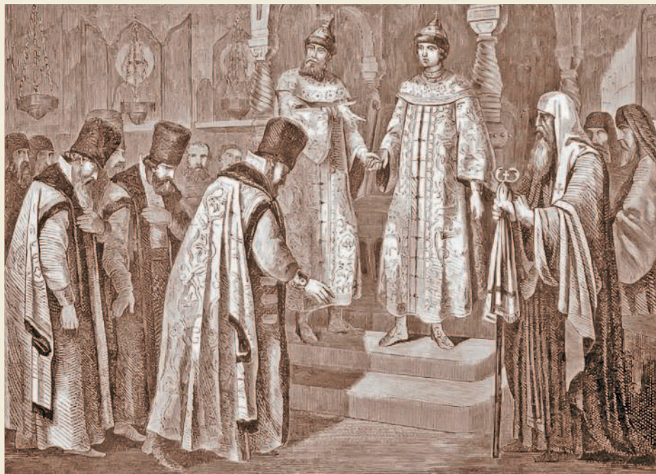
Василий Темный и его сын Иван. В.П. Верещагин

▶ Василий Темный сделал девятилетнего ребенка своим соправителем, чтобы в будущем избежать обычной для того времени междоусобной войны за престолонаследие — младшие братья, вечный источник опасности, должны были привыкнуть к особенному положению старшего. Однако эта мера, предпринятая во имя государственной стабильности, оказалась мудрой и еще в одном смысле: в 1460 году она спасла великого князя от гибели.