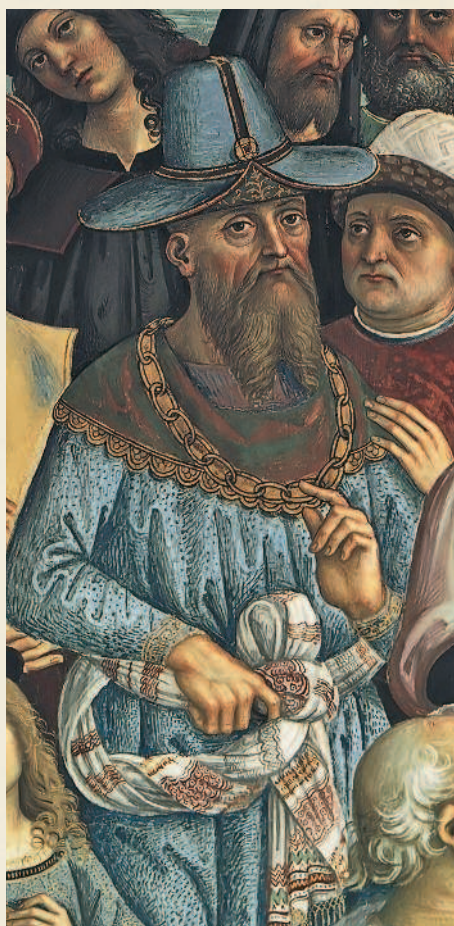
Фома Палеолог, деспот Морейский, отец Зои. С фрески Пинтуриккио

Таким образом, партия была не такой уж блестящей, тем более что к 1468 году Зоя осиротела. Два ее предыдущих жениха, сын мантуанского маркиза и захудалый король кипрский, поразмыслив, от такой невесты отказались. Зоя была бесприданницей и жила на иждивении у римского папы, из милости и довольно скудно. Павел II был рад избавиться от этой обузы, тем более что хитрый Вольпе наобещал понтифику, что таким образом можно