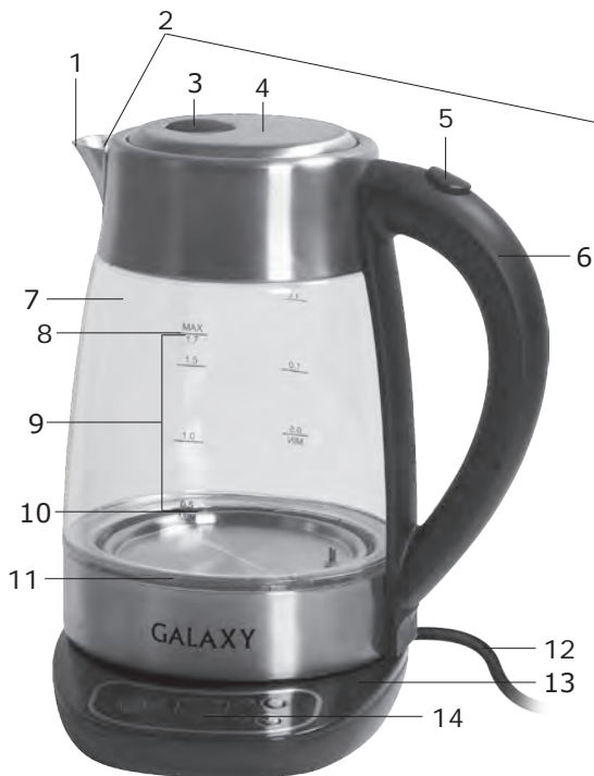
Рис. 1 Общий вид