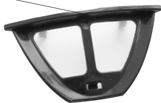
Рис. 3 Съёмный фильтр