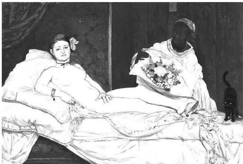
Эдуард Мане. Олимпия. 1863. Музей Орсе, Париж