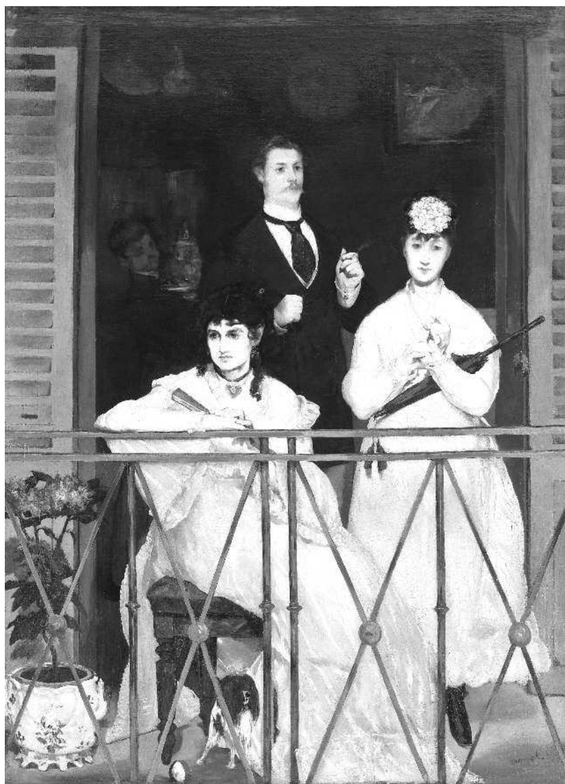
Эдуард Мане. Балкон. 1868—1869. Музей Орсе, Париж