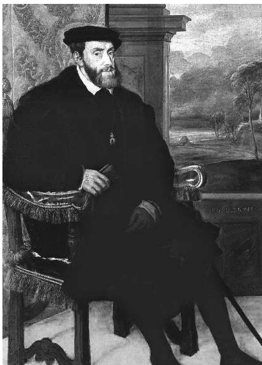
Тициан. Портрет Карла V в кресле. 1548. Старая пинакотекa, Мюнхен

Венецианцы обожали женскую красоту, но в их живописи отсутствует какая-то женская активность в жизни. Женщины там присутствуют больше для любования. А «Сельский концерт» можно назвать пасторалью, причем не просто пасторалью, а пасторалью идеальной: в ней есть гармония всего со всем, гармония мира с человеком, растворенным в этой природе. Посмотрите на эти линии рук, на прозрачный кувшин... И картина называется «Концерт» не из-за того, что эти люди испол-