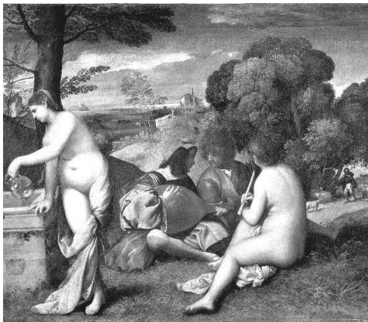
Джорджоне. Сельский концерт. 1508–1509. Лувр, Париж

На картине Джорджоне «Сельский концерт» мы видим обнаженные женские фигуры и одетые мужские. Это такой своеобразный пикник. Группа людей сидит на холме и музицирует — у них в руках музыкальные инструменты. Посмотрите, как написаны женщины — словно плоды. Надо сказать, что флорентийские художники писали женщин длинными, худыми, истеричными и напряженными, хотя флорентийки