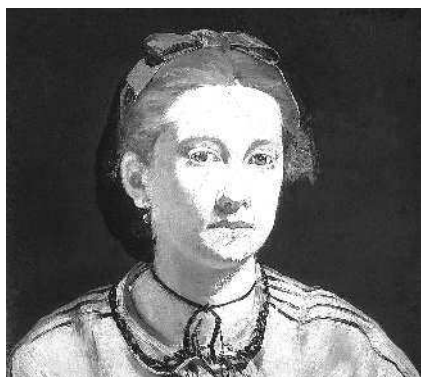
Портрет Викторины Мёран работы Эдуарда Мане. 1862. Музей изящных искусств, Бостон