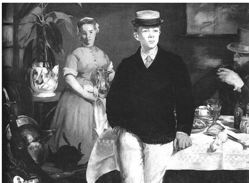
Эдуард Мане. Завтрак в мастерской. 1868. Новая пинакотека, Мюнхен

Посмотрите, как одет герой картины «Завтрак в мастерской»: какие белые брюки, рубашка, галстук — такой щеголь для модного журнала «Сноб», продукт того времени. Обратите внимание на стол. Герой стоит перед очень хорошо убраным столом, рядом какая-то служанка. Это эпоха расцвета ресторанной жизни во Франции, и натюрморт написан так, как его писали малые голландцы. Эта картина написана Эдуардом Мане