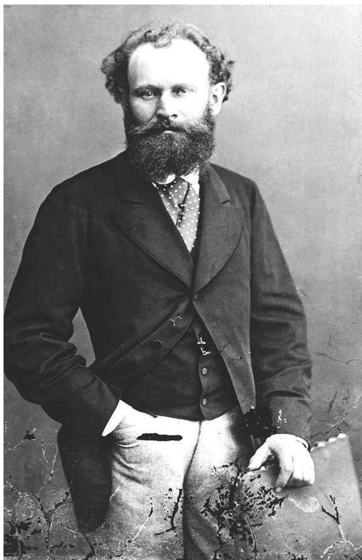
Эдуард Мане, портрет