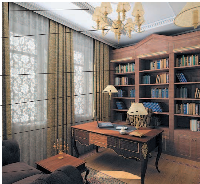
서재 сочжэ кабинет