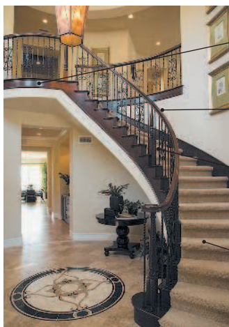
현관 현관 прихожая