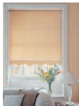
커튼 кхотхын штора