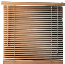
블라인드 пыллаинды жалюзи