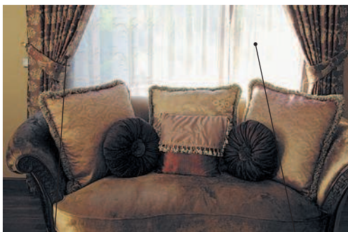
커튼 кхотхын портьера