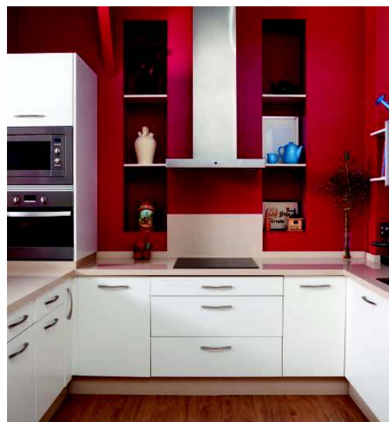
▲ В интерьере оттенки красного могут использовать для того, чтобы сделать его более собранным и создать яркий контраст, к примеру, между отделкой и мебелью