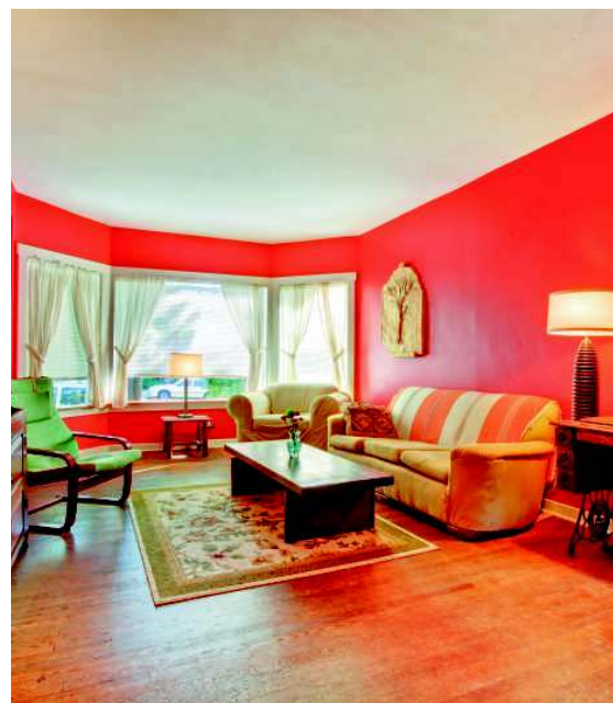
▲ Большое количество красных поверхностей может быть только в очень просторной комнате

Приступая к рассказу о палитре, исследователи, как правило, обращаются к началу спектра. Красный цвет ассоциируется с кровью и огнем. Этот пигмент довольно устойчив, тем не менее чистый алый, который со временем не поменял бы оттенка, удалось получить далеко не сразу. Такой цвет популярен в культурах, в которых придают большое значение узам кровного родства. Красный бодрит, разжигает страсть, но его обилие может вызывать подавленность и нервозность или переутомление. Нередко именно этот цвет провоцирует агрессию. Он весьма распространен в геральдике. Правда, военная символика и многочисленные революционные движения, деятели которых выбирали красный для обозначения боевых намерений, успели достаточно его дискредитировать.