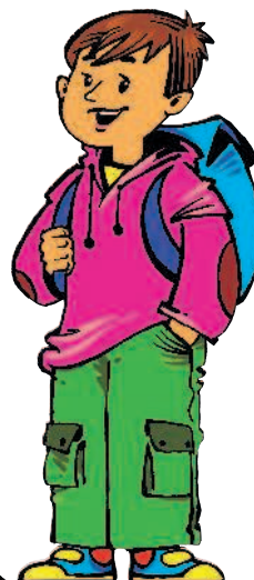
brother [БРАЗЭ] брат