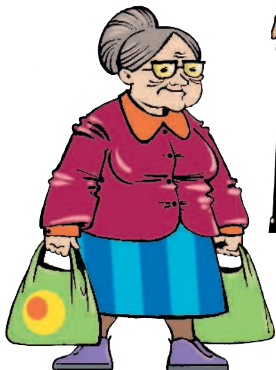
grandmother [ГРЭНМАЗЭ] бабушка