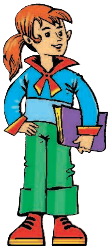
sister [СИСТЭ] сестра