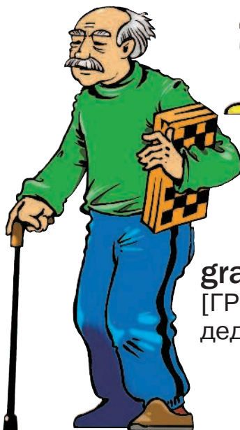
grandfather [ГРЭНФА:ЗЭ] дедушка