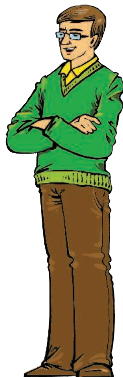
father [ФА:ЗЭ] отец