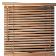
die Jalousie жалюзи