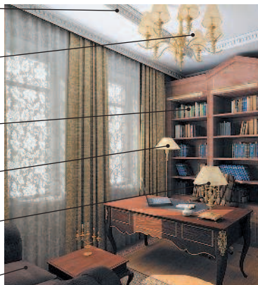
das Arbeitszimmer кабинет