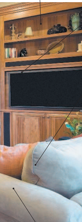
die Vitrine сервант