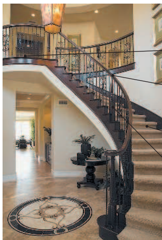
der Treppenabsatz лестничная площадка