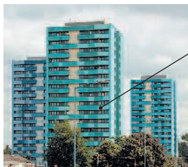
der Wohnblock многоквартирный дом