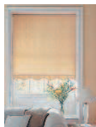
der Rollvorhang штора