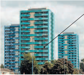
아파트 многоквартирный дом