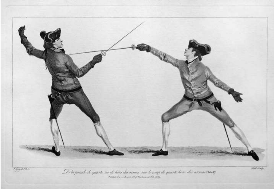
Тренировка фехтовальщиков. Гравюра. XVIII в.