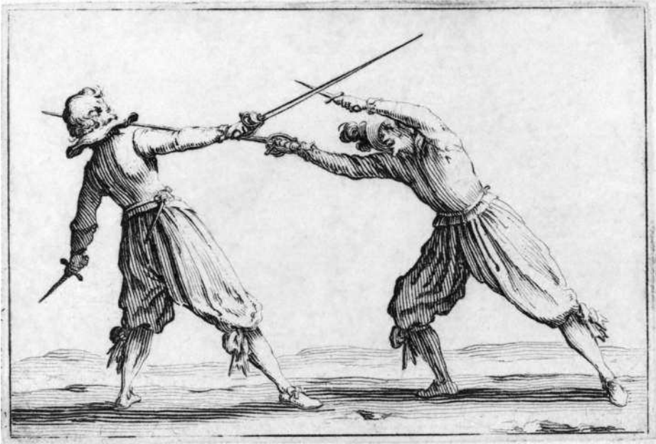
Ж. Калло. Дуэль на шпагах и кинжалах. 1622 г.