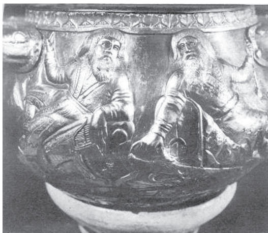
Рис. 1.3. Изображения скифов на ритуальной чаше, найден- ной в Запо- рожской области.

Эти казацкие переселенцы несли военную службу, но весьма ограниченную, и им было предоставлено право заниматься земледелием, но уже без особых льгот. Многие запорожские казаки ушли на Кубань, а часть из них Екатерина II взяла в Петербург для несения дворцовой караульной службы «по расписанию». Еще в то время Екатерина II раздала большое количество семей из запорожской вольницы в крепостные своим приближенным вельможам.