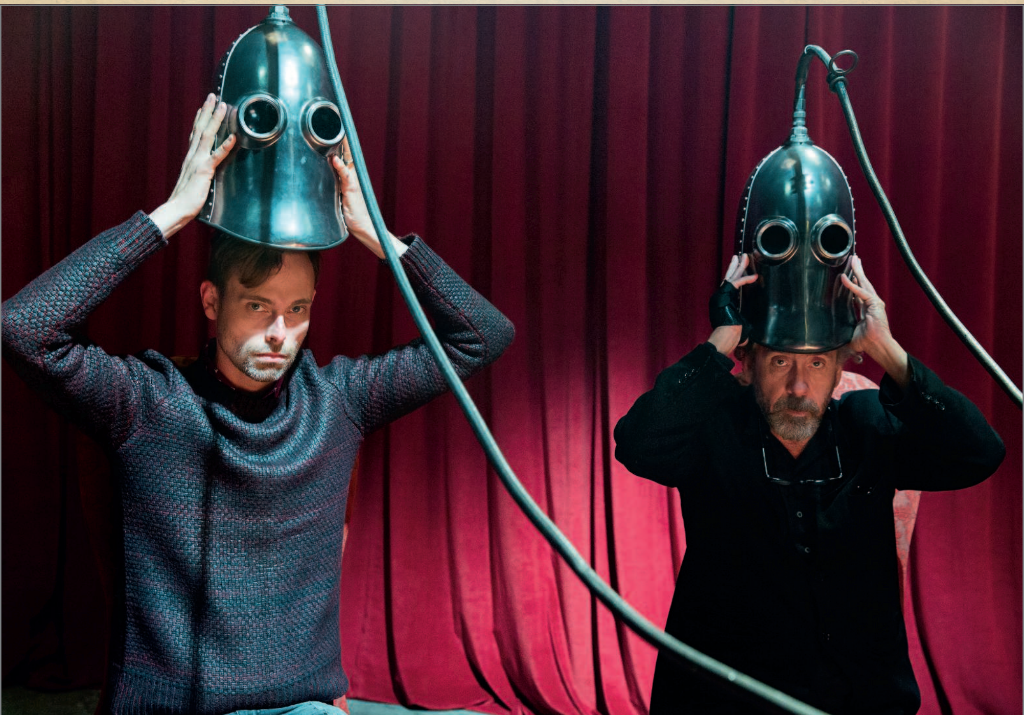
НАПРОТИВ: Продюсеры фильма: Питер Чернин (справа) и Дженно Топпинг на ступеньках, составляющих часть декораций. ВВЕРХУ: Создатели вселенной «Мисс Перезгин»: писатель Ренсом Риггз (слева) и кинорежиссер Тим Бёртон