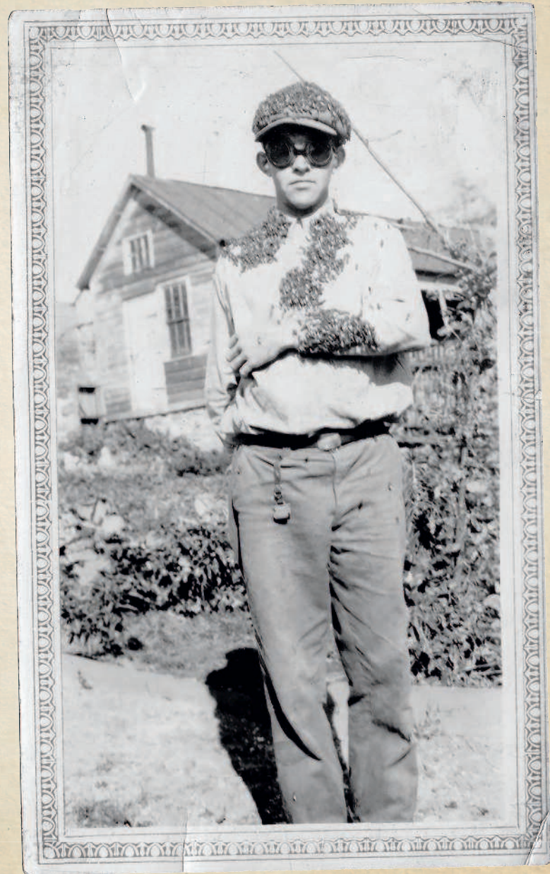
Винтажное фото «Мальчик и его пчелы», вошедшее в роман Риггза

подстраивалась под картинку, – продолжает Риггз. – Поэтому результат зачастую выходил неожиданным, и мне это даже нравилось. Приятно было хотя бы отчасти передать управление богу случайностей, впрыснуть в работу немного хаоса и посмотреть, куда это меня приведет».