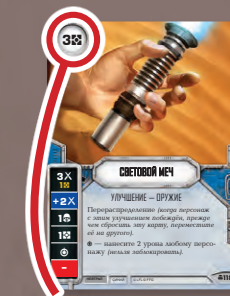
СТОИМОСТЬ В РЕСУРСАХ