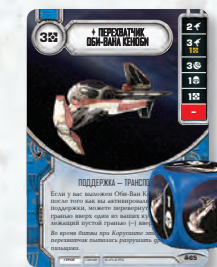
ПОДДЕРЖКА (С КУБИКОМ)