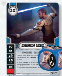
УЛУЧШЕНИЕ (С КУБИКОМ)