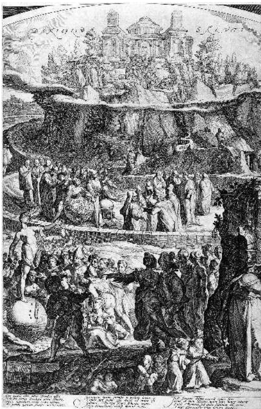
Я. Матаам. «Табличка» Кебета». Гравюра. 1592 г. Музей искусств округа Лос-Анджелес

любопытства, но радуется, как простой свет, потому что все в ней — блеск и драгоценность, все «питает и услаждает зрение», а не раздражает и не возбуждает его.