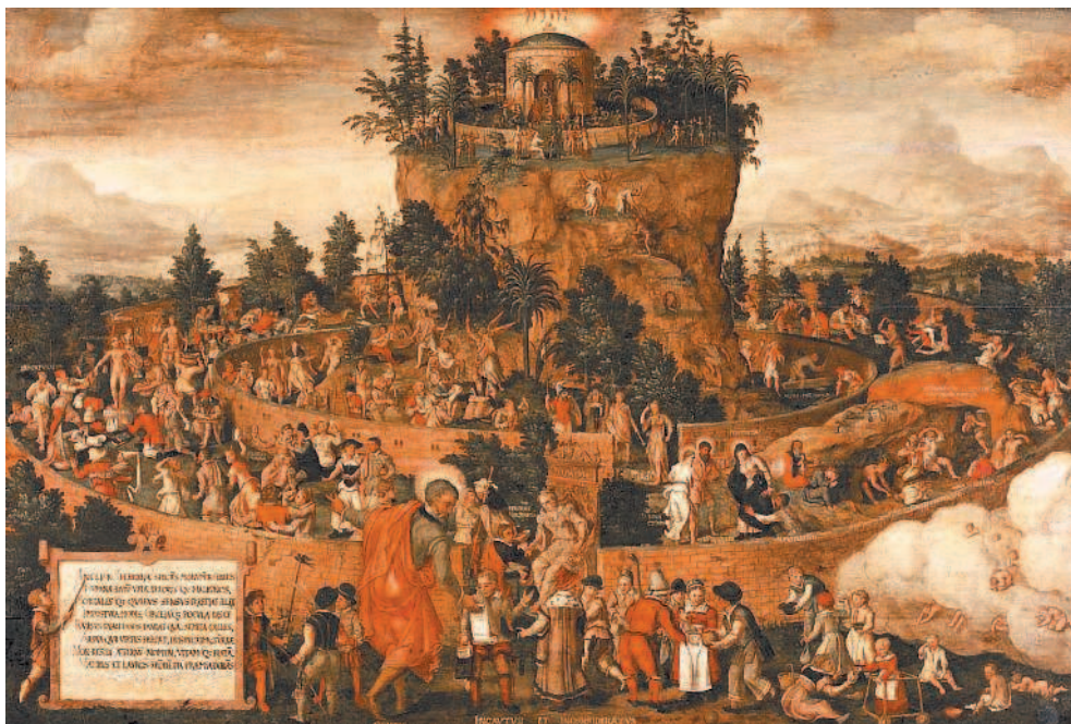
Неизвестный художник. «Табличка» Кебета, или Путешествие человеческой жизни». 1573 г. Рейксмузеум, Амстердам

дела ограды: ведь они помогают очиститься, что надлежит сделать еще прежде того, как войти к Добродетелям. Названные дары не просто отдельные вещи или качества, а настоящие врачи «для поддержки (принятия) и здоровья. А если человек не послушается предписаний врача, то, разумеется, он будет выгнан и истреблен смертью». Как мы сейчас видим, экфрасис, описание воображаемой картины, не просто превращает отдельные отвлеченные понятия в олицетворенные фигуры специальными усилиями. Олицетворенным может стать все что угодно прямо по ходу повествования, с легкостью, хотя в начале повествования оно таким не было.