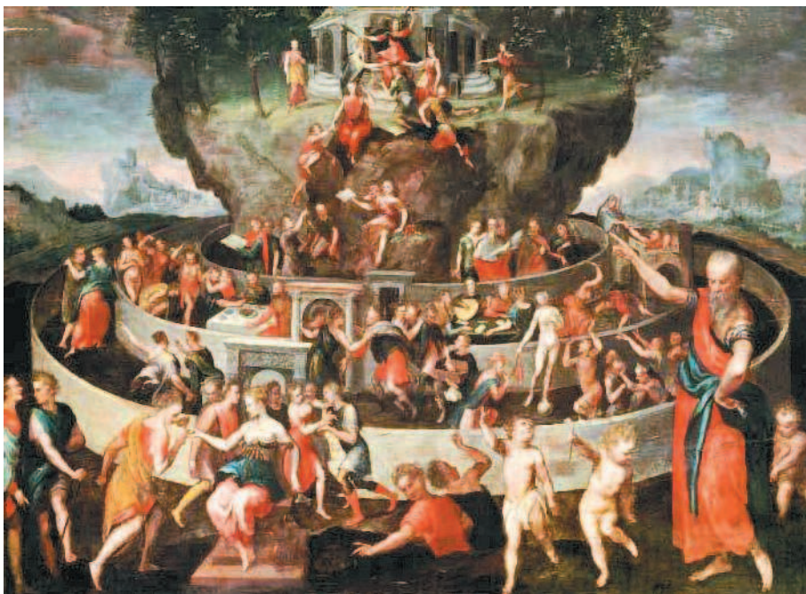
К. Варен. «Табличка» Кебета». Ок. 1600 г. Музей изящных искусств, Руан

бе, «непритворны они, и совершенно не имеют украшений, в отличие от всех других женщин». Можно сказать, они олицетворяют саму идею стройности правильных дел, где не нужно отвлекающих излишеств, как не положено мастеру отвлекаться во время серьезной работы.