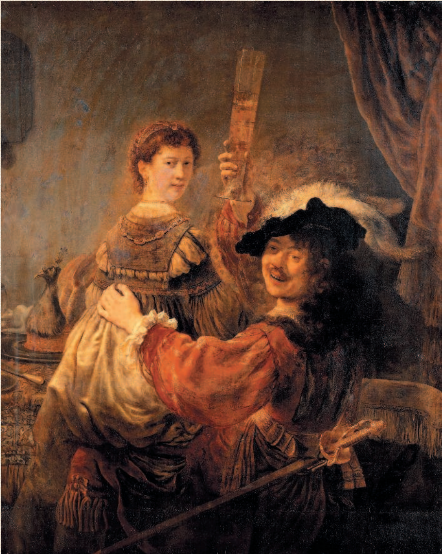
Рембрандт. «Автопортрет с Саскией на коленях». 1637 г. Дрезденская картинная галерея (Галерея Старых мастеров), Дрезден