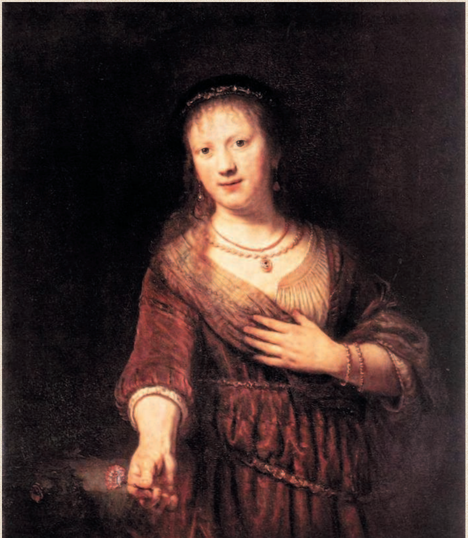
Рембрандт. «Саския с красным цветком». 1641 г. Дрезденская картинная галерея (Галерея Старых мастеров), Дрезден