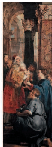
Рубенс. «Снятие с креста». Между 1612 и 1614 гг. Собор Антверпенской Богородицы, Антверпен

них всю мощь таланта, данного свыше. Искусство стало мостом над пропастью тяжелого периода в жизни.