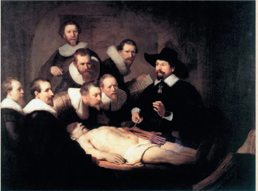
Рембрандт. «Урок анатомии доктора Тульпа». 1632 г. Королевская галерея Маурицхейс, Гаага