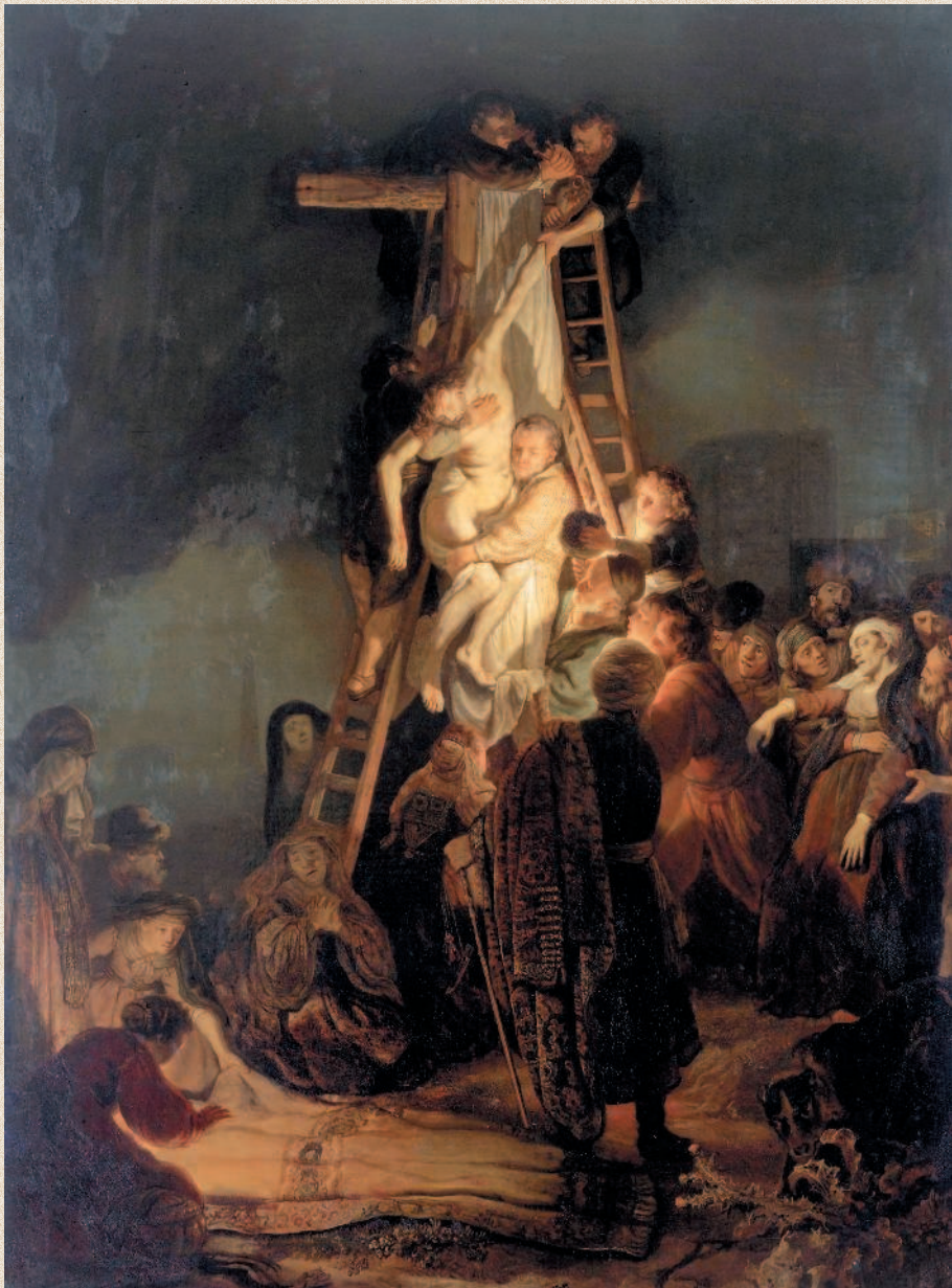
Рембрандт. «Снятие с креста». 1634 г. Государственный Эрмитаж, Санкт-Петербург