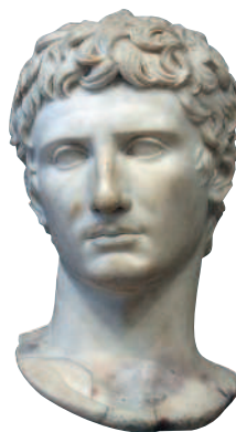
Цезарь Октавиан Август

В Иудейском царстве эта процедура существенно отличалась от римской, проводившейся по месту жительства. Здесь перепись велась по древнему иудейскому обычаю — по коленам (племенам) и родам. Поэтому каждый иудей был обязан записаться по месту происхождения его рода. Так как праведный Иосиф вел свою родословную от царя Давида, то для записи своего имени он должен был отправиться в Вифлеем — на родину своего царственного предка. Туда же, несмотря на свое положение,