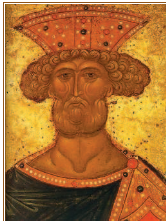
Святой царь и пророк Давид Псалмопевец

Оставив в стороне Иерусалим, порядком уставшие после пятидневного (!) «путешествия» путники спешили в Вифлеем, чтобы найти, наконец, приют и отдохнуть после утомительной дороги. Особенно тяжело приходилось Пресвятой Деве Марии — вот-вот должна была наступить самая ответственная минута Ее жизни... Уже смеркалось, когда, преодолев последний затяжной подъем, они оказались в Вифлееме.