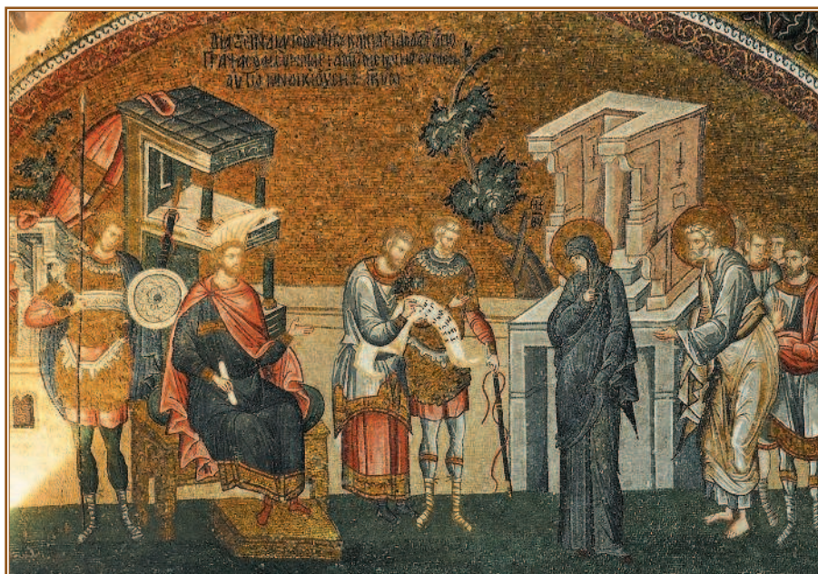
Пресвятая Дева Мария и праведный Иосиф Обручник участвуют в переписи. Монастырь Хора, Константинополь