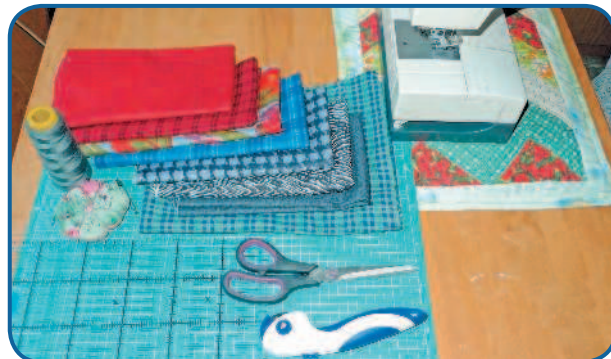
Рис. 1. Ткани и инструменты для работы

Важно! Главное, чтобы вы могли выкроить 28 квадратов размером 20 × 20 см и четырнадцать полос размером 11 × 20 см (семь блоков нужно сшить из полос, чтобы максимально использовать ткань). То есть из каждой ткани нужно выкроить по четыре полных квадрата и по две полосы.