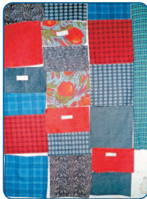
Рис. 4а. Маркировка полос перед сборкой в квадраты

Полосы в квадраты сколоть по длинной стороне. Теперь непосредственно о шитье: весь пэчворк шьется на припуск, а это означает, что расстояние от правого края лапки (если вы правша) до острия иглы определяется шириной лапки. В разных машинках он различается, но условно его можно считать равным 0,75 см. Более точно можно померить линейкой. Минимальный припуск в пэчворке равен 0,5 см. Важный момент — это длина стежка при