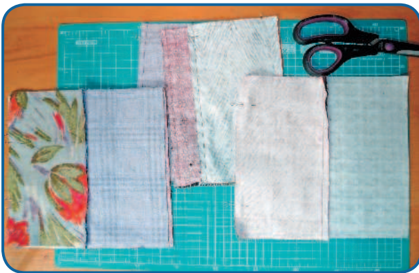
Рис. 4в. Швы на квадратах заутюжить вниз

сшивании деталей. Она должна быть небольшой, не более 2,2 мм.