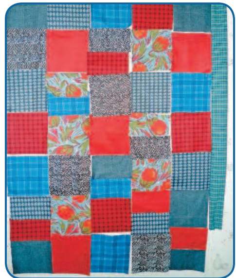
Рис. 3. Создание макета будущей работы

Макет удобнее выкладывать (раскалывать) вертикально. Чтобы не портить обои булавками, можно сделать рабочий экран, повесив его на стену на время работы. Для этого к деревянной рейке кнопками приколоть белую ткань, а с торцов в нее вбить маленькие гвоздики. Затем привязать к гвоздикам веревку, и экран готов. Можете вешать его на стену.