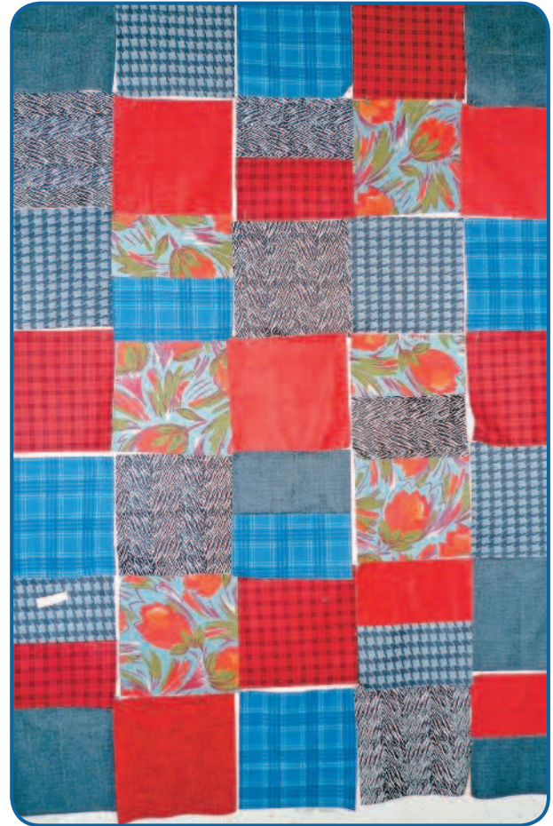
Рис. 5. Сшитые и проглаженные квадраты приколоть на свое место в макете

Подготовленные для сшивания детали (сложенные и сколотые между собой полосы) выложить справа от машинки и по очереди сострочить, подавая одну сборку за другой, не обрывая нить. Такой способ можно назвать «гирляндой» или «флажками». Обратите внимание на то, чтобы расстояние, прошитое «в воздухе», то есть между сборками, было не меньше 1 см.