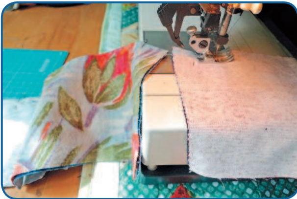
Рис. 4б. Последовательная сборка полос в квадраты