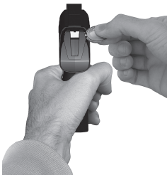
REGULACIÓN DEL ALZA REARSIGHT ADJUSTMENT REGLAGE DE LA HAUSSE VISIEREINSTELLUNG REGULAÇÃO DA ALÇA