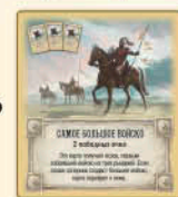
Самое большое войско