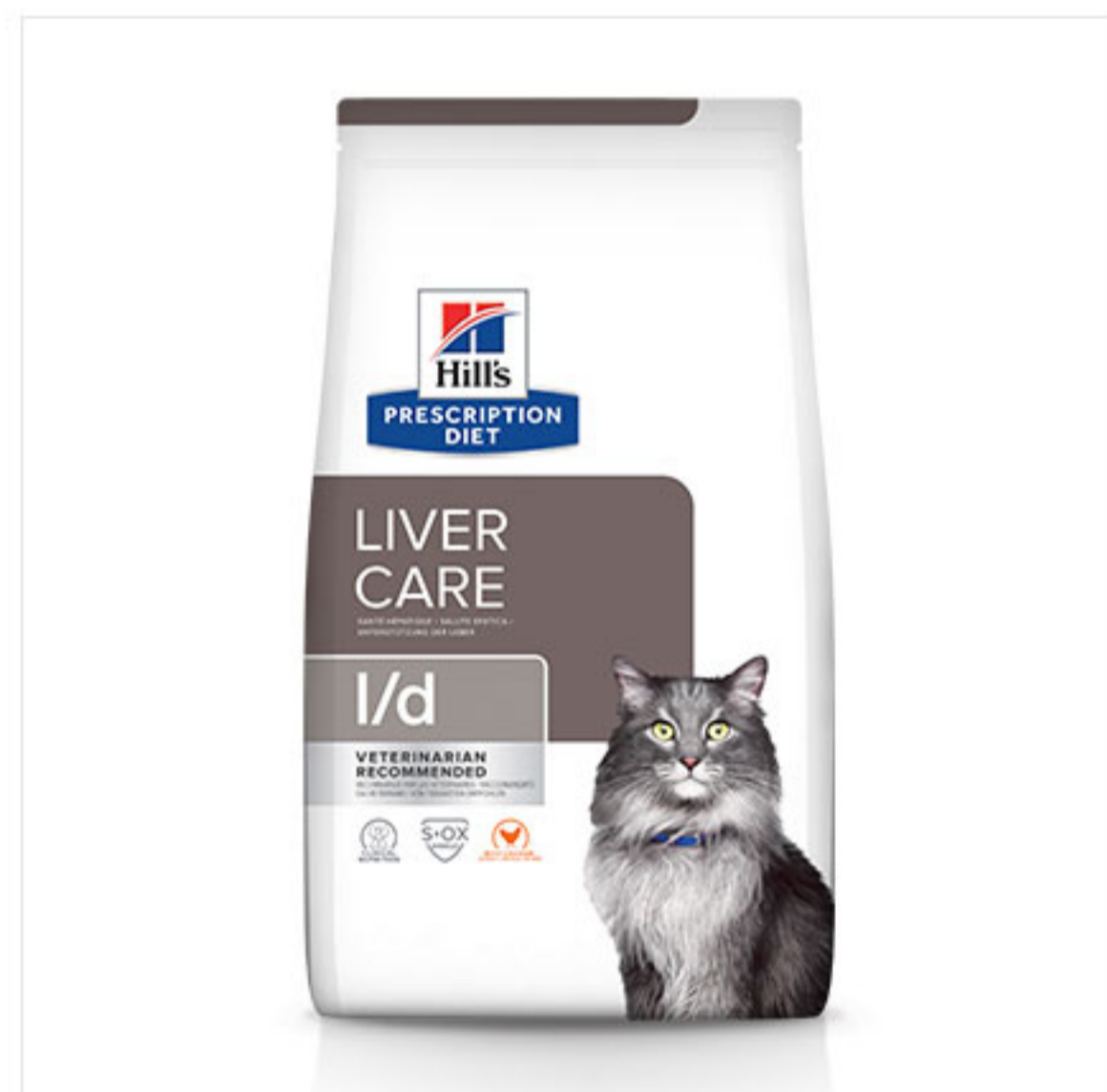
Hill's PRESCRIPTION DIET I/d. Диетический корм, который поддерживает функцию печени.

Hill's предлагает диетические корма для кошек при различных заболеваниях печени. Прежде, чем перевести кошку на PRESCRIPTION DIET, проконсультируйтесь с ветеринарным специалистом. На все корма Hill's действует программа 100% ГАРАНТИЯ КАЧЕСТВА, КОНСИСТЕНЦИИ И ВКУСА или мы вернем деньги, чтобы Вы были уверены, выбирая Hill's.