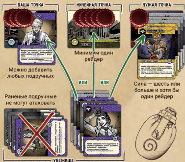
Рис. 7. Три варианта налёта на территорию. Сила атакующего отряда Безупречных равна 7, так как сила каждого фанатика в атаке равна 2.