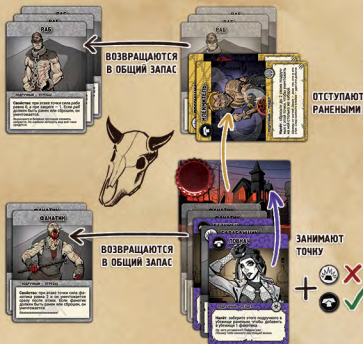
Рис. 8. Пример последствий налёта.

Если у вас закончились карты отребья – замените их любыми подручными средствами. Пушечное мясо в Пустошах никогда не заканчивается.