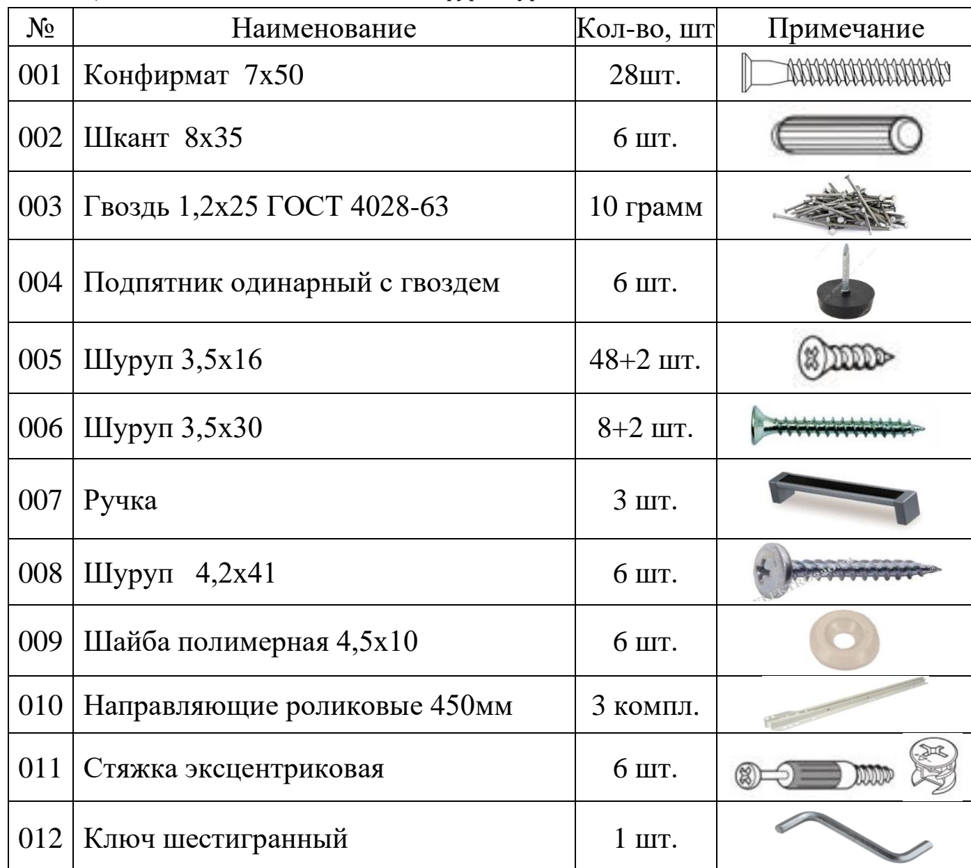
Таблица №2: Комплектность метизов и фурнитуры