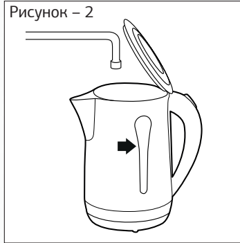
Рисунок – 2

— Наполните чайник холодной водой, следите за метками.