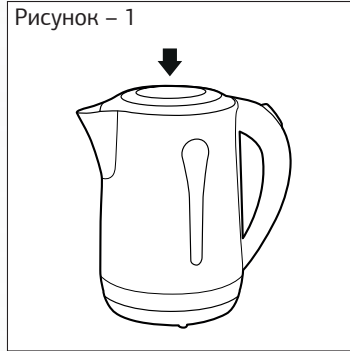
Рисунок – 1