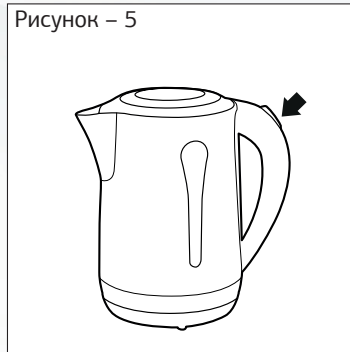
Рисунок – 5

— Перед снятием с базы убедитесь в том, что чайник выключен (переключатель в положении 0).