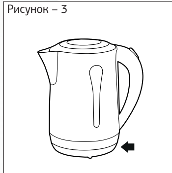
Рисунок – 3

— Наполните чайник холодной водой, следите за метками.