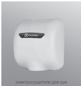
электросушители для рук