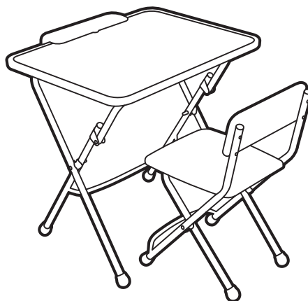
(рис. 2) арт. Д3А, Д3С

Перед эксплуатацией следует ознакомиться с паспортом и руководством по эксплуатации. Следуя инструкции, выполните установку стола и стула.